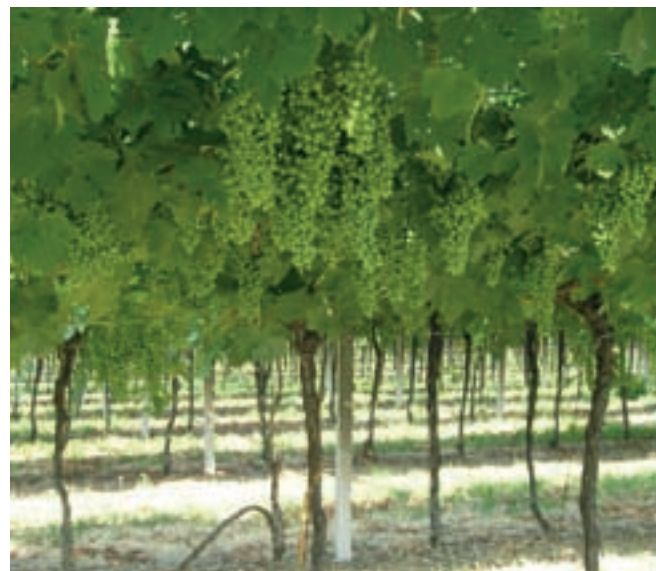
En helt annan form av kärnkraft.