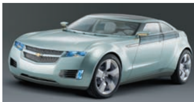
Chevrolet Volt har en räckvidd på 65 kilometer per laddning. Batteriet kan laddas från urladdat till fullt på tre timmar i ett 240-voltsuttag.