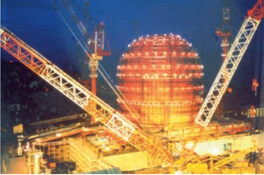
Byggandet av Tomari kärnkraftverk i Japan.