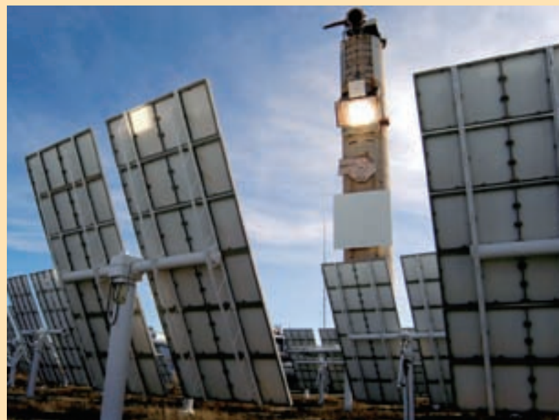
Ett termiskt solkraftverk fungerar i princip som vilket värmekraftverk som helst. Tekniken bygger på att solljuset koncentreras till en punkt för att uppnå temperaturer som möjliggör ångproduktion för drift av till exempel ångturbiner. Bilden föreställer ett så kallat soltorn vid experimentanläggningen Plataforma Solar i södra Spanien.