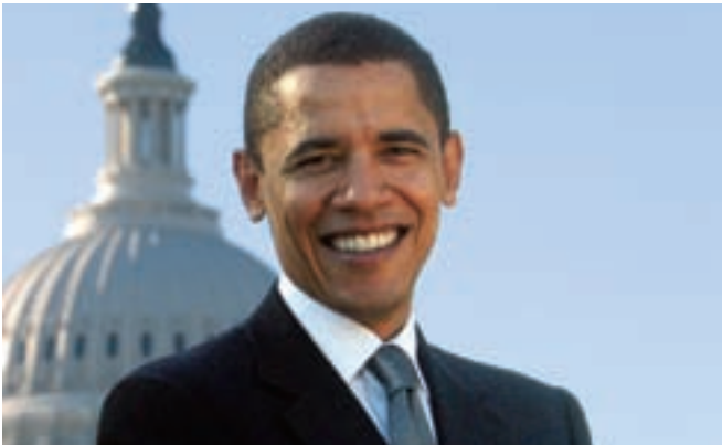
USAs president Barack Obama vill ha både utsläppshandel och CO 2 -lagring men stöter på hårt motstånd.

Med president Barack Obama har USA fått en helt annan miljö-/klimatpolitik än den som fördes av föregångaren George W Bush. Redan under presidentvalskampanjen drev Obama linjen att USA kraftigt måste minska sina utsläpp av CO 2 .