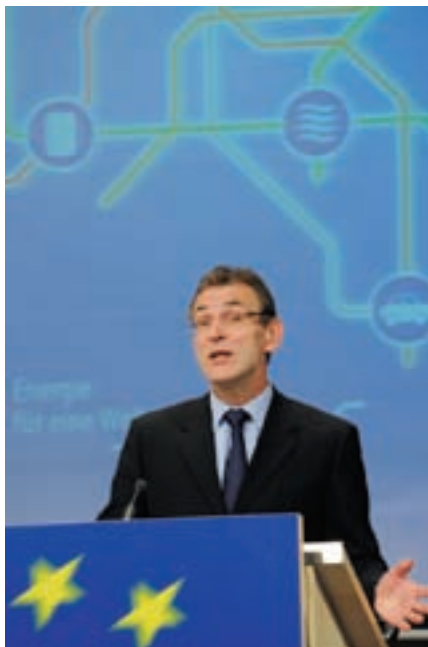
EU-kommissionären för energifrågor, Andris Piebalgs är en av dem som har lotsat fram EU:s så kallade klimatpaket. Enligt detta ska unionens utsläpp av CO 2 minska med minst 20 %. För att detta ska vara möjligt krävs CCS.

Ändå är det långt från ord till handling. Vilket i och för sig inte är så märk-