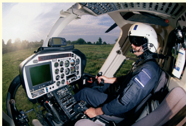
Ett 30-tal elnätsföretag har deltagit i pilottester.

Den nya modellen har tagits fram av El i dialog med kundföreträdare och elbranschen. Pilottester har genomförts med ett 30-tal elnätsföretag och erfarenheter har inhämtats från andra länder. Detta borgar för en bättre framtida reglering av elnätsavgifterna.